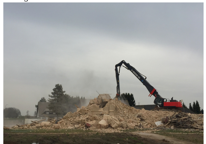
Der Abriss des Immerather Doms im Rheinischen Braunkohlerevier durch den Stromkonzern RWE ist ein Beispiel für die gewaltsame Zerstörungskraft von Kapitalinteressen und Profitmaximierung.